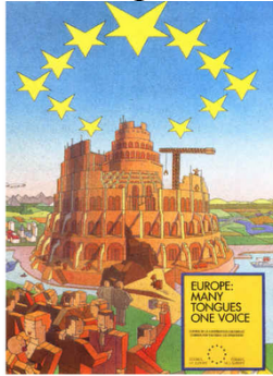
Il Poster Ritirato