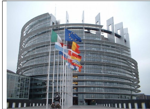
Parlamento europeo (edificio Louise Weiss)