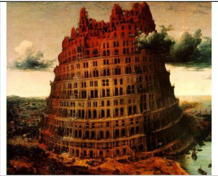
Torre di Babele di Bruegel

Da : http://poterioculti.mastertopforum.biz/-vp13688.html ho estratto : in un articolo molto lungo dal titolo Mass Immigration And The New Tower Of Babel di RevolutionHarry si cita un manifesto, in seguito ritirato, dell'Unione Europea http://revolutionharry.blogspot.it/2011/06/mass-immigration-and-new-tower-of-babel.html